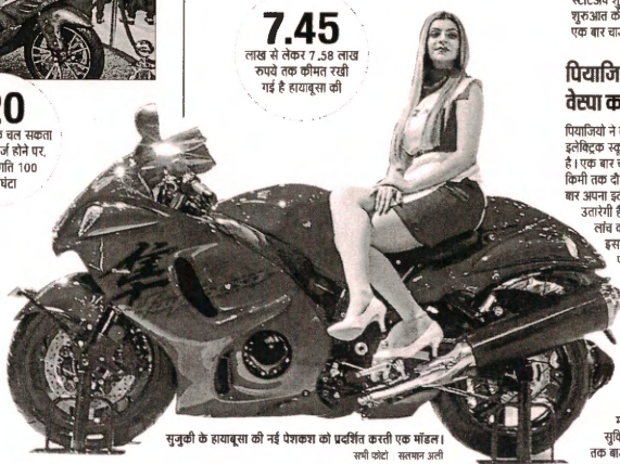
सुजुकी के हायाबूसा की नई पेशाकॉ को प्रदर्शित करती एक महिला। सभी सोटों, स्लॉवर जूती

7.45 लाख से लेकर 7.58 लाख रुपये तक कीमत रखी गई है हायाबूसा की