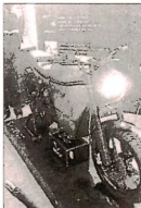
विद्युत कंपनी की इलेक्ट्रिक बाइक